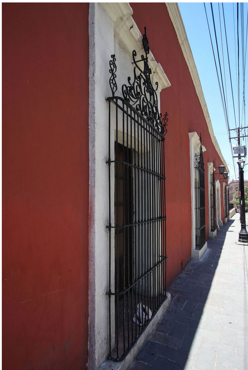
Frente del recinto y puerta principal hacia la calle de Juárez, con cinco ventanas protegidas con enrejados, a los cuales se les agregaron motivos masónicos en su remate durante el período de recuperación y restauración del inmueble.