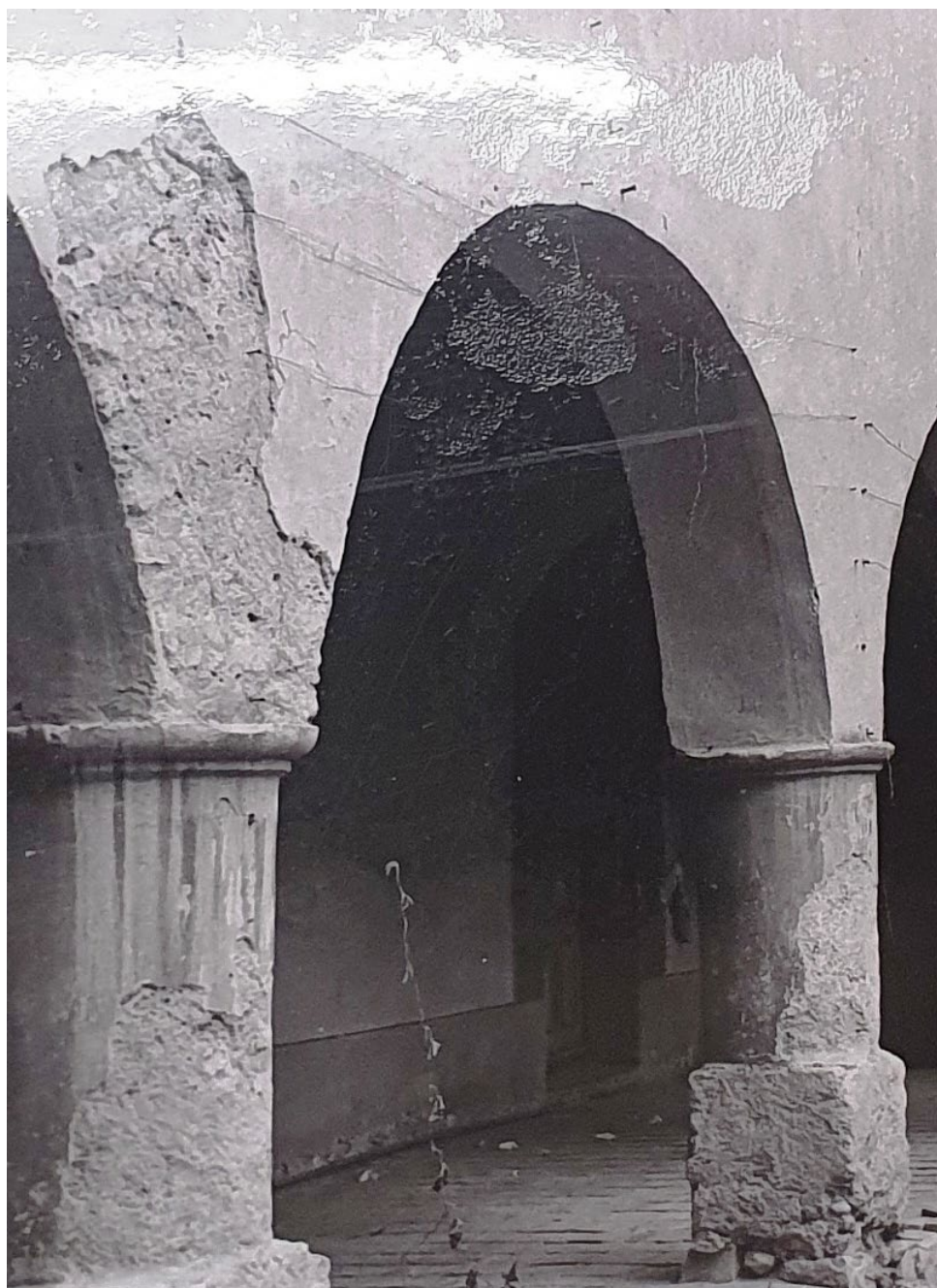
Patio interior con sus arcos y soportal al lado oriente de la casa en 1956.