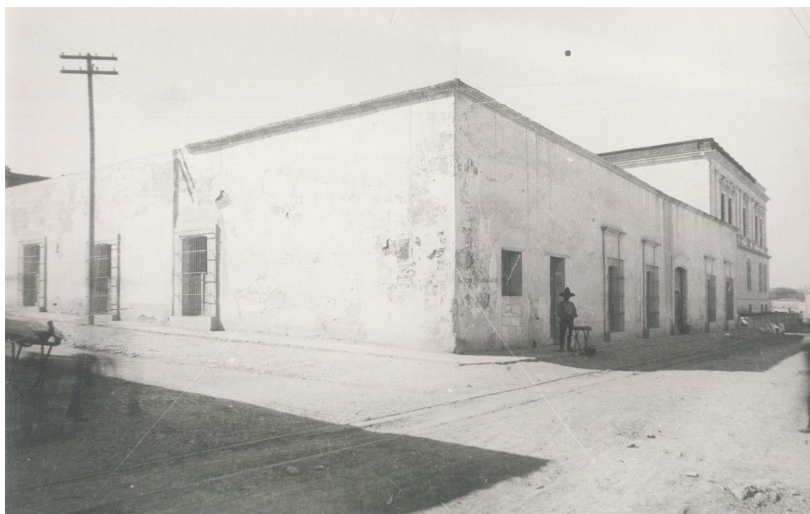
Vista de la casa que sirvió por varias décadas como obispado. Fotografía tomada Ca. 1910.

llo, tanto su parroquia como las casas de gobierno y las que ocupaban los vecinos principales, debieron tener de manera paulatina una modificación en sus formas de construcción desde mediados de ese siglo, como lo fue el inicio de la edificación misma de la parroquia de Santiago, la que es probable fuera, antes de las obras que actualmente conocemos, apenas una construcción de adobe con techo de viguería, y nada más.