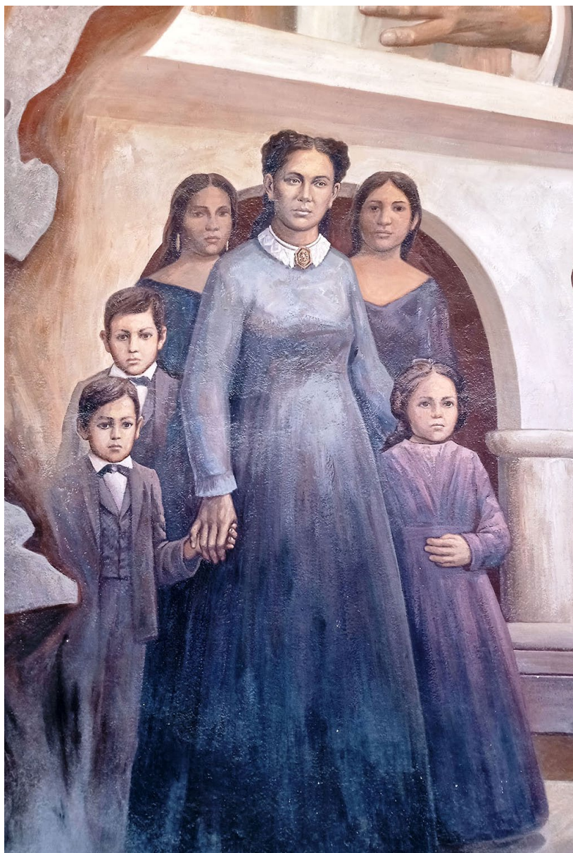
Doña Margarita Maza de Juárez acompañada de sus hijas e hijos, quienes residieron en la casa desde finales de noviembre de 1863 hasta abril de 1864. Mural en el Palacio de Gobierno. Saltillo, Coahuila.