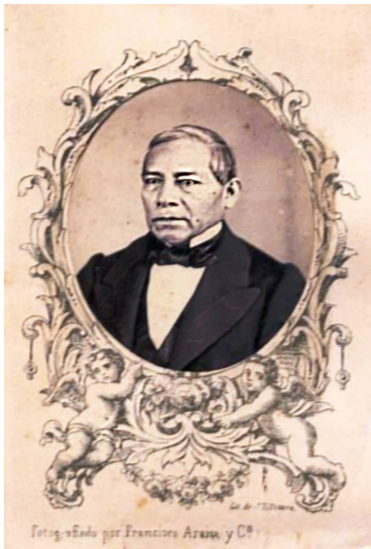
Lic. Benito Juárez quien desde el 9 de enero hasta principios de abril de 1864 residió en la casa en compañía de su familia. Albúmina tomada al final de la intervención francesa. San Luis Potosí, 1867.