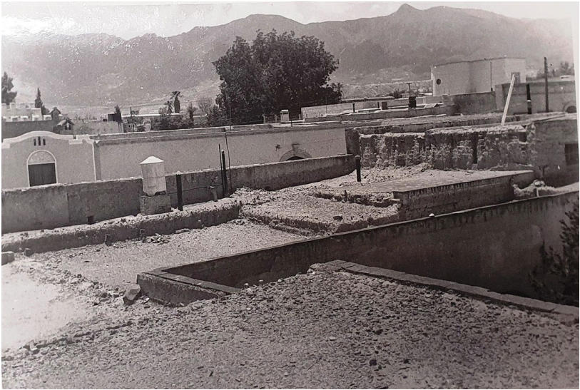
Vista de los techos de terrado de las habitaciones del exobispado en 1956, al fondo el sur de la ciudad y la sierra de Zapalinamé. Colección Archivo Histórico del Obispado de Saltillo.

que se tienen, cuando uno quiere, o tiene necesidad de moverse. 9