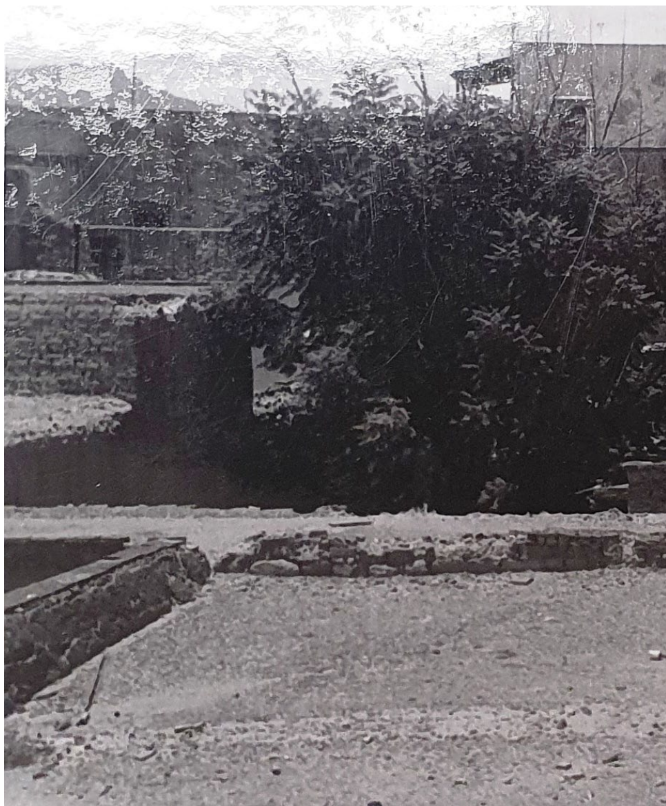
Parte del traspatio de la casa con construcciones de adobe en 1956, espacio que antiguamente había colindado con corrales de la misma propiedad. Al fondo, construcciones hoy desaparecidas y la cúpula del templo de San Juan Nepomuceno.